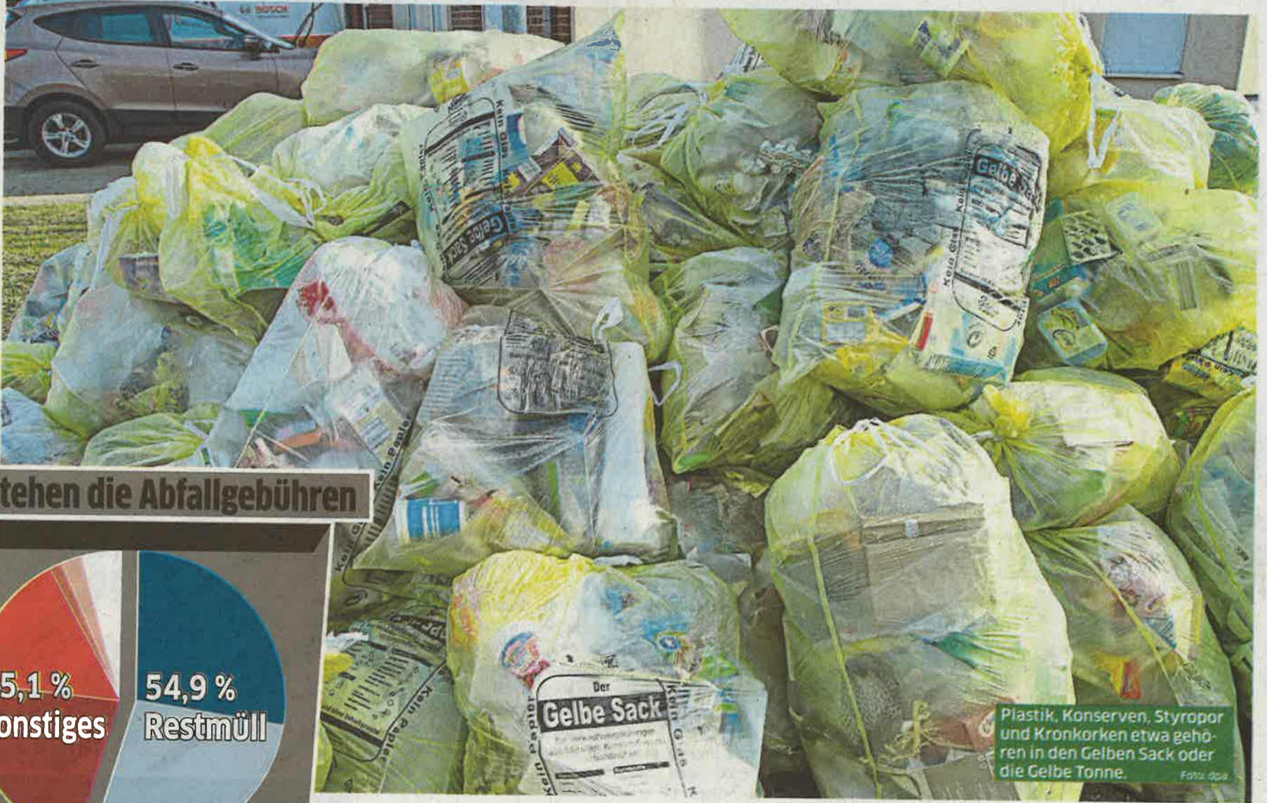
Plastik, Konserven, Styropor und Kronkorken etwa gehören in den Gelben Sack oder die Gelbe Tonne.

Allerdings: auch Kölner Plastikmüll geht ins Ausland, wird als „Ware“ verkauft. Doch der Kölner „Export“ ist sogar gut für die Umwelt – solange er vorher in der Gelben Tonne gelandet war. Beispiel: Eine Shampoo-Flasche aus Plastik. Für deren Herstellung wird Rohöl benötigt, das erstmal nach Deutschland geschifft werden muss, weil hier keins gewonnen wird. Gar nicht gut für die Umwelt. Landet die Shampoo-Flasche dann auch noch in der grauen Mülltonne für Restmüll, wird sie verbrannt. Wer seine leere Shampoo-Flasche aber in die Gelbe Tonne